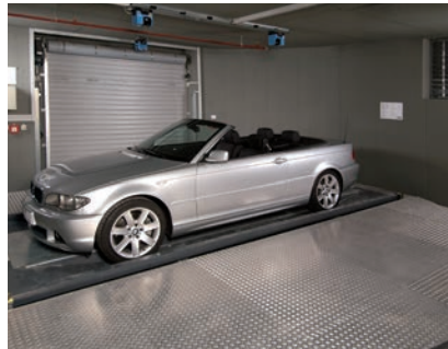
05 Da sich der Übergabebereich im 90° Winkel zur unterirdischen Parkebene befindet wird das Fahrzeug vor dem Einlagern um 90° gedreht

Laserscanners at the ceiling of the transfer area check the correct positioning of the car.