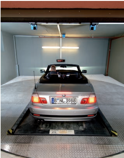
04 Laserscanner an der Garagendecke prüfen die richtige Parkposition des Pkw.

There is only one transfer area on courtyard level necessary from where the car is transported by means of a vertical lift into the parking level. The movements are cycled by longitudinal and lateral shiftings, requiring two empty places within the system.