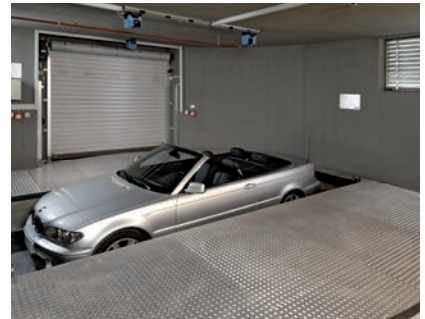
06 und abgesenkt.

As the transfer area is positioned at an angle of 90° towards the parking level the car is turned for 90° before reaching the parking level